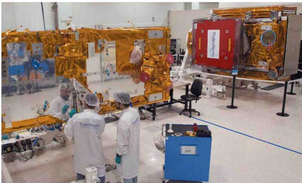
Sopra, il Test Center di Thales Alenia Space in via Tiburtina, a Roma, dove è stato integrato e testato il satellite Sentinel 1C