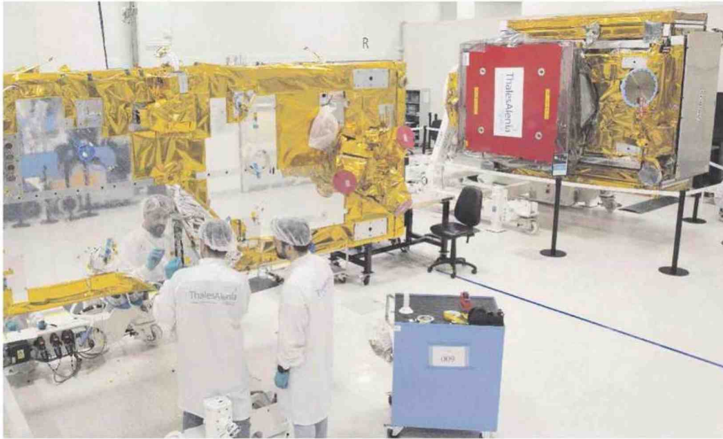
Sopra, il Test Center di Thales Alenia Space in via Tiburtina, a Roma, dove è stato integrato e testato il satellite Sentinel 1C